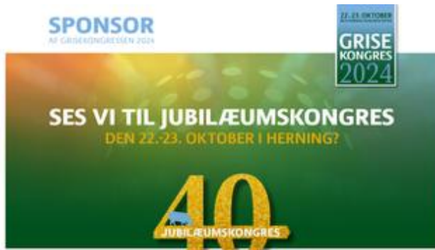
Billede fra Landbrug & Fødevarer sektor for gris

LVK er guldsponsor for Grisekongressen i Herning. Vi glæder os til at deltage og se mange af jer ved vores stand. Vi har hørt, at der allerede strømmer ind med tilmeldinger og interessen for årets kongres er stor.