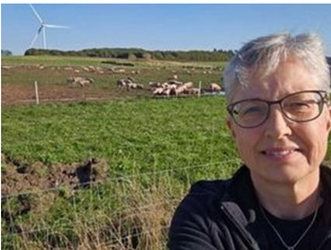
Billede: Anne Ovesen

Her er det hos en økolog i det vestjyske: